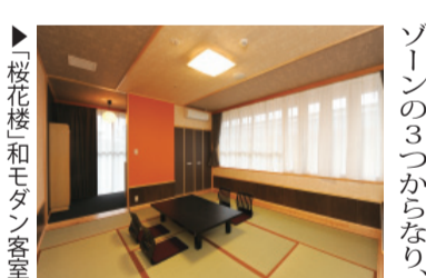
浦安万華郷正面玄関 / 桜花楼和モダン客室